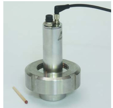
Edelstahlschauglasleuchte Typ 1400 mit Schauglasarmatur „Bullauge“, passend für Abmessungen nach DIN11851 Stainless steel luminaire type 1400 combined with a sightglass according to DIN11851