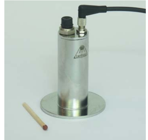
Edelstahlschauglasleuchte Typ 1400 Stainless steel luminaire type 1400

Easy installation and maintenance due to plug and socket connection M5, including 3 metre cable as standard, 5 and 10 metre cable available on demand.